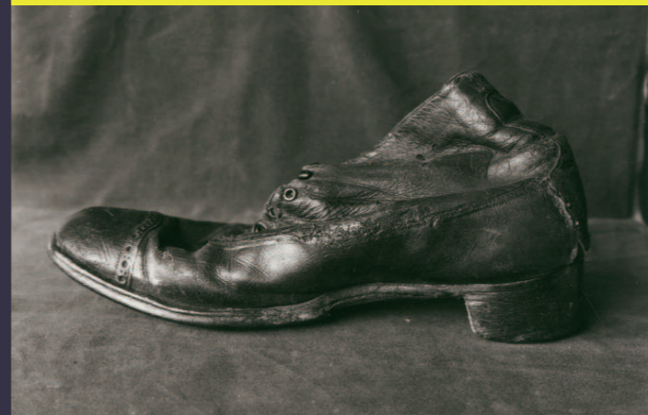
In der Mitte eingesunkener alter Herrensuh. Aufnahme 1926, Silbergelatinepapier

The Fagus Factory produced articles for the shoe industry, primarily shoe lasts made of beechwood. The company's name is derived from the Latin term for beech – fagus . The Fagus Factory pursued a reformist approach in this industrial sector by promoting the manufacture