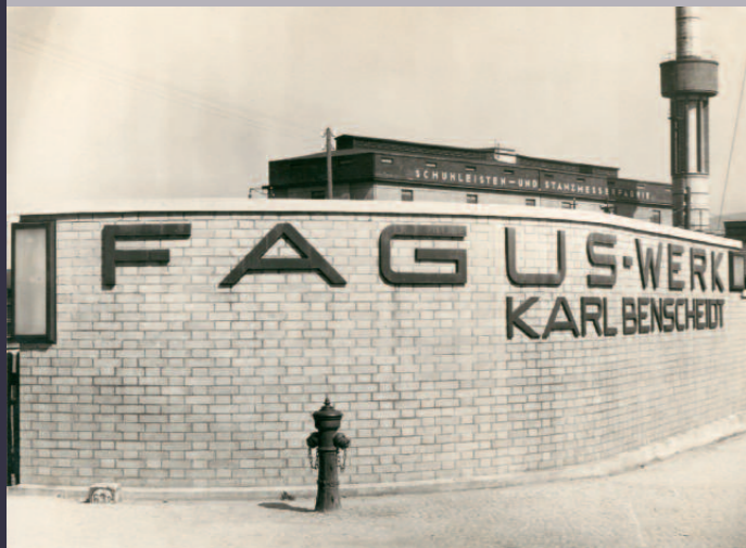
Fagus-Werk, Alfeld/Leine, Fagus-Schriftzug auf der Eingangsmauer. Aufnahme 1928, Silbergelatinepapier

Das Fagus-Werk produzierte Artikel für die Schuhindustrie, vor allem Leisten, die aus Buchenholz gefertigt wurden. Aus der lateinischen Bezeichnung für Buche – fagus – leitet sich der Name des Unternehmens ab. Innerhalb der Branche verfolgte das Fagus-Werk einen reformerischen Ansatz, indem es sich für die Her-