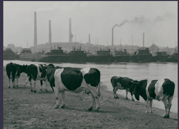
Ruhrmündung bei Duisburg. Aufnahme 1930, Silbergelatinepapier

of healthy shoes. It supported the work of an orthopaedic specialist, for whom Albert Renger-Patzsch produced over 300 photographs. They depict both healthy and deformed feet as well as good and bad footwear. A selection of these photos is shown in the exhibition.