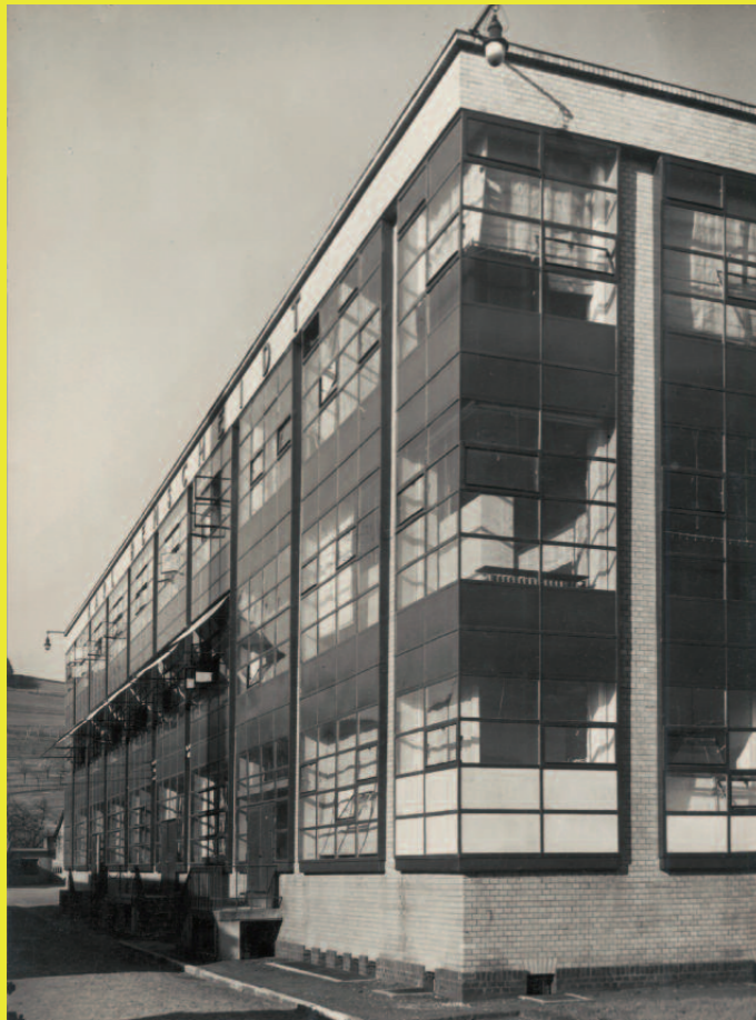
Fagus-Werk, Alfeld/Leine, Blick auf die Südost-Ecke des Hauptgebäudes. Aufnahme 1928, Silbergelatinepapier Titelmotiv: Schubhügleisen. Aufnahme 1928, Silbergelatinepapier