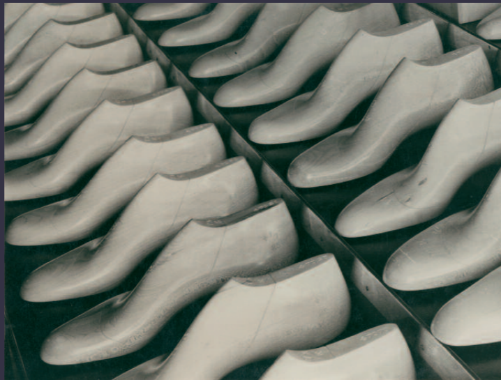
Fagus-Werk, Alfeld/Leine, Schuhleisten (Ausschnittvergrößerung). Aufnahme 1928, Silbergelatinepapier

stellung von fußgerechten Schuhen einsetzte. Es unterstützte die Arbeit eines Orthopäden, für den Albert Renger-Patzsch mehr als 300 Fotos anfertigte. Sie zeigen gesunde und deformierte Fußskelette sowie richtiges und falsches Schuhwerk. Eine Auswahl dieser Aufnahmen wird in der Ausstellung zu sehen sein.